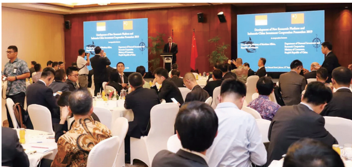
中国-印度尼西亚投资合作项目推介对接会现场

除积极参加经营推介会，葛洲坝海外机构以商（协）会为平台积极参与使领馆组织的各类文化推广活动，向世界展示中企风采，增进各方人文交流。在今年的全巴基斯坦中资企业协会和全巴基斯坦工商总会举行的中华人民共和国成立70周年庆祝活动中，葛洲坝巴基斯坦分公司负责外联和宣传工作，以极高热情参与活动的组织策划。分公司巴方员工出任英文主持，中方员工排练的舞蹈“丝路情缘”活动获得现场中外嘉宾的一致好评。