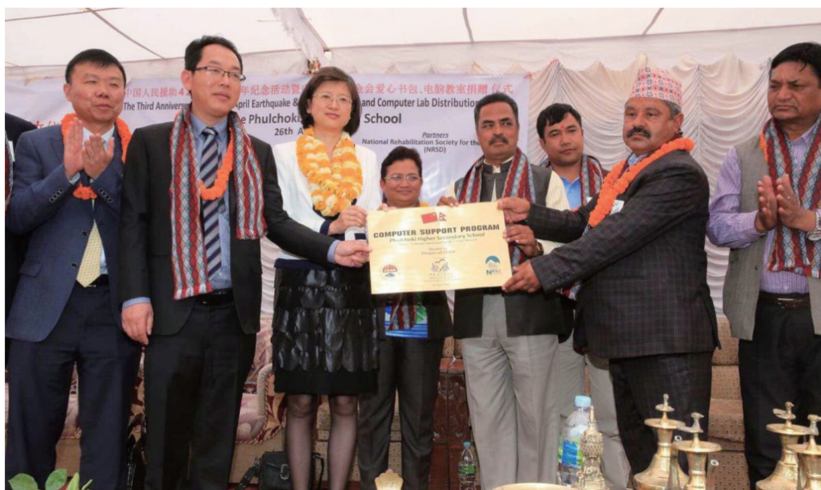
尼泊尔抗震救灾捐赠现场