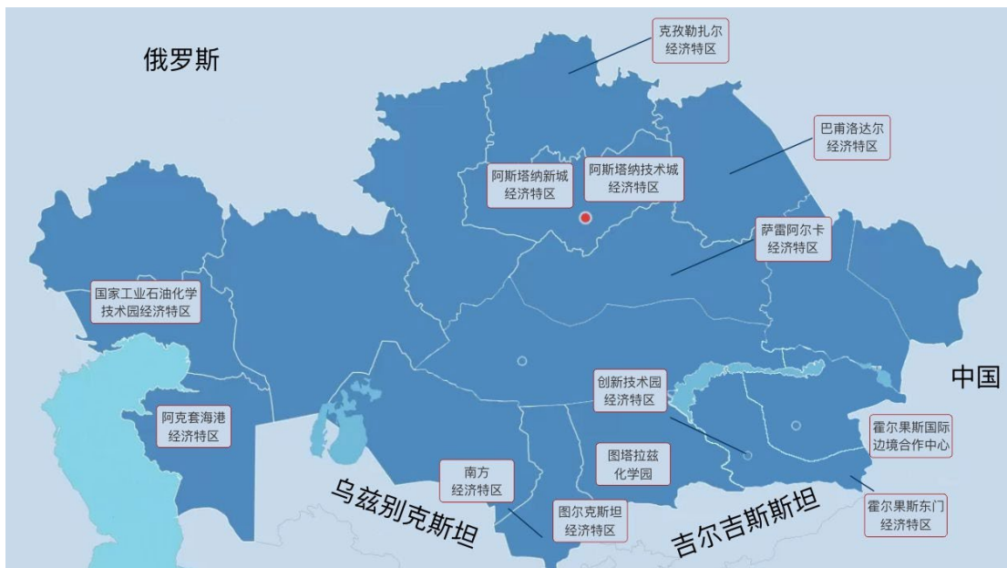
图 3-1 哈萨克斯坦经济特区分布图

截至目前，哈萨克斯坦共设立 13 个经济特区（见图 3-1），各经济特区根据其功能定位确定了不同的主导产业。有关投资优惠政策及经济特区详细介绍见本报告第九章专题四板块。