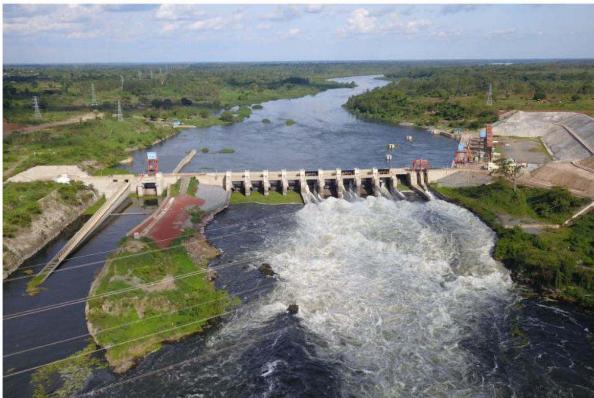
图 1-3 卡鲁玛水电站