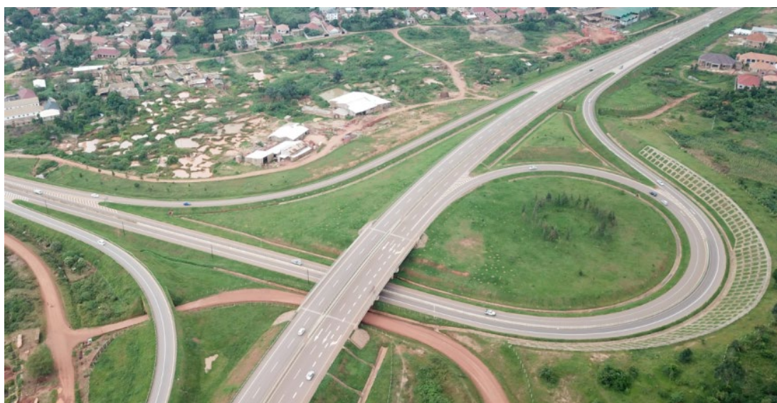
图 1-5 乌干达首都坎帕拉至恩德培机场高速路

乌干达的空运基础设施相对落后，机场数量少，而且使用效率低。截至2016年末，乌干达共有47家机场，其中14家机场由乌干达民航局负责运营。恩德培国际机场为主要的大型国际机场，也是乌干达唯一的口岸机场，距首都坎帕拉约45公里。未来，乌干达拟新建5个国际机场作为口岸机场，以促进贸易和旅游。由中交承建的恩德培国际机场改扩建项目正在进行，截至2023年年底，该项目已完成总进度的91%。