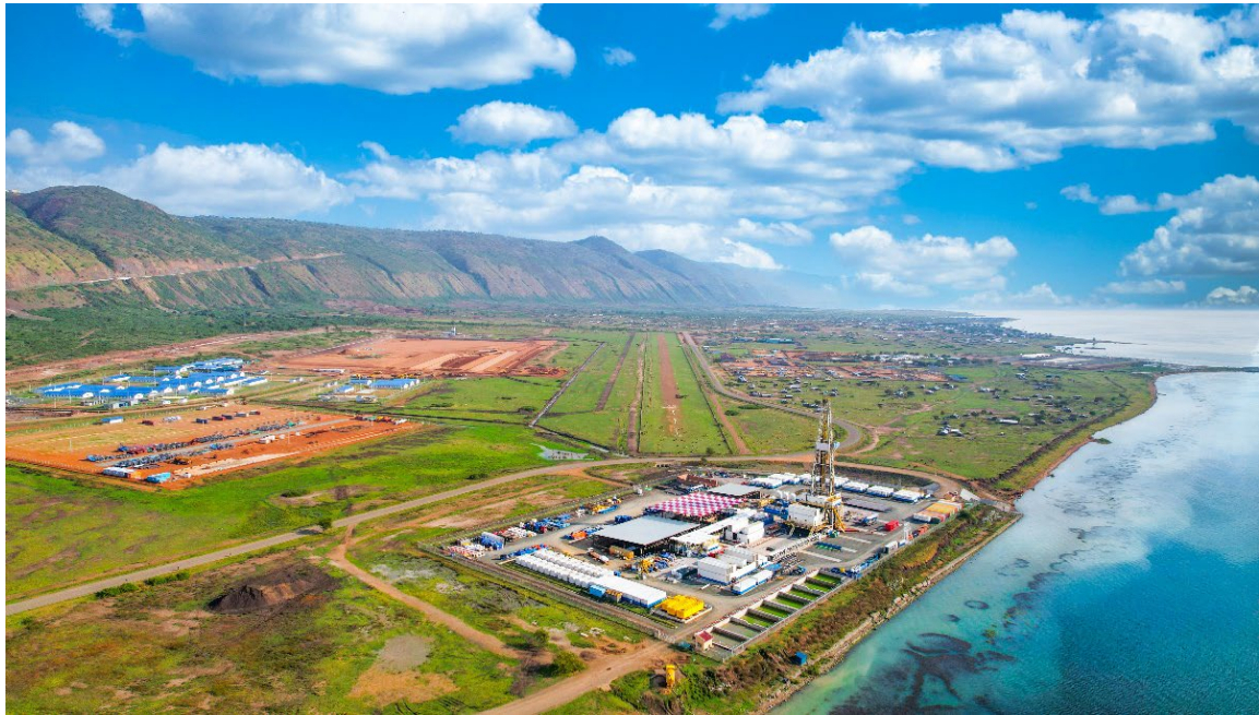
图 1-4 阿尔伯特湖油田项目鸟瞰图

(2) 融资贷款：中资企业在乌干达进行融资贷款，为当地企业和个人提供了资金支持 and 经营发展的机会。通过向乌干达的企业和个人提供融资服务，中资企业帮助他们扩大生产规模、改善生产设施、引进新技术和设备，推动了乌干达的产业发展和经济增长。中资企业的融资贷款还为创业者提供了启动资金，促进了创新和创业精神的培育。此外，中资企业还积极与乌干达政府合作，支持基础设施建设项目的融资，促进了乌干达的经济转型和现代化进程。