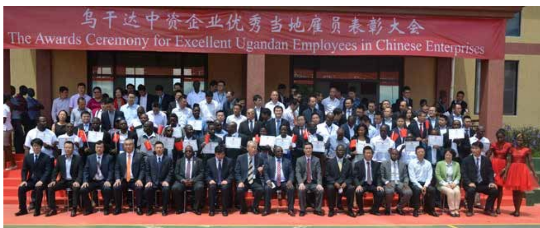
图 1-13 乌干达中资企业优秀当地雇员表彰大会