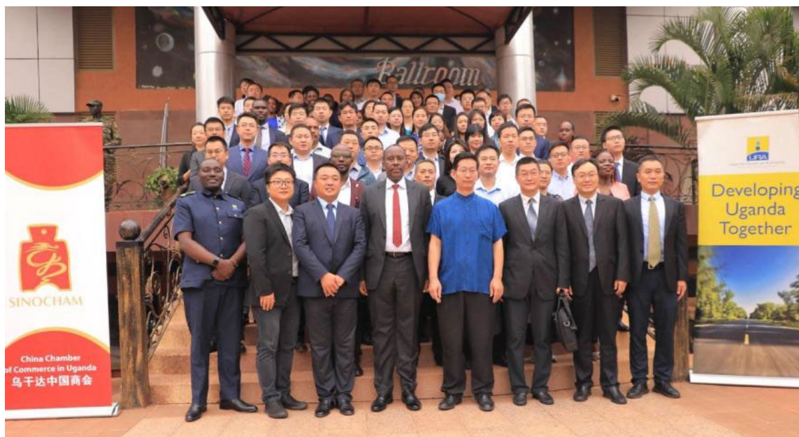
图 1-7 《乌干达税务指南》中文版发布会现场

2024年1月5日，乌干达税务局与乌干达中国商会签署了谅解备忘录，并发布了中文版《乌干达税法指南》，该中文版税法手册是中乌伙伴关系的见证，是促进投资兴业的有效举措，体现了中乌构建开放、公平、公正营商环境的真诚努力。