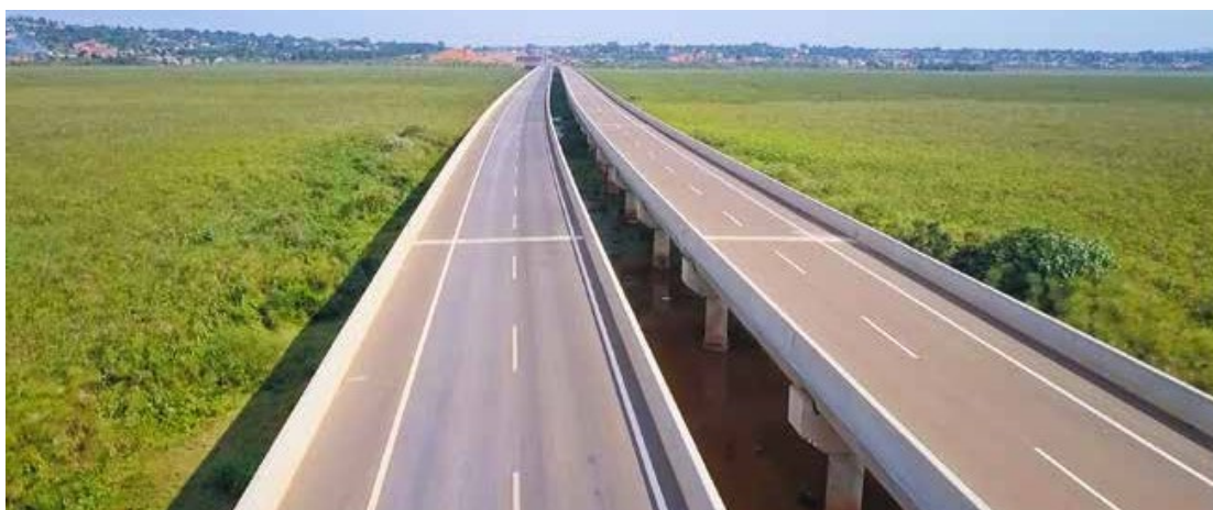
图 1-14 中企在沼泽地上建起的 Nambigirwa 长桥

综上所述，中资企业在医疗卫生、教育、社会慈善和社会环境等领域为乌干达社会做出了积极贡献。通过投资和支持医疗设施、教育设施的建设和发展，提供可靠的医疗和教育服务；通过捐赠和社区慈善活动，改善社区和弱势群体的生活条件；通过关注环境保护和可持续发展，减少对环境的负面影响，中资企业为乌干达人民和社区带来了实实在在的益处，以上务实举措都为努力推动乌干达社会的进步和可持续发展做出了积极贡献。