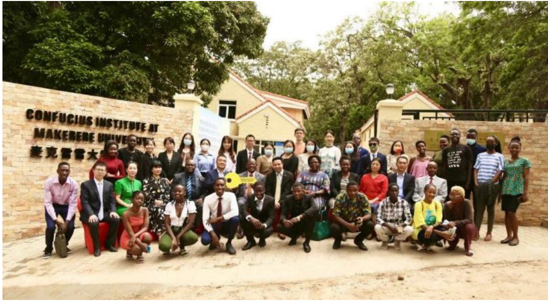
图 1-11 麦克雷雷大学孔子学院改造项目移交仪式