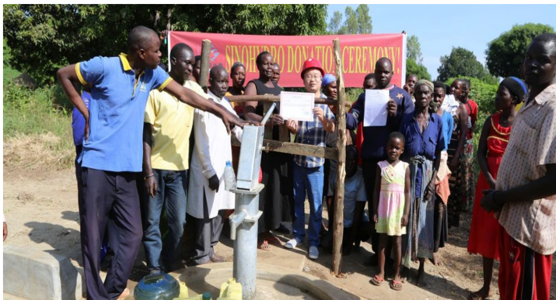
图 1-12 中资企业为当地居民捐助水井

技能实操、语言提升三方面课程，切实提高属地现场工程师、工长的业务知识、技能水平，培养属地中端人才。培训为期 12 天，共有 32 名属地雇员参加学习。