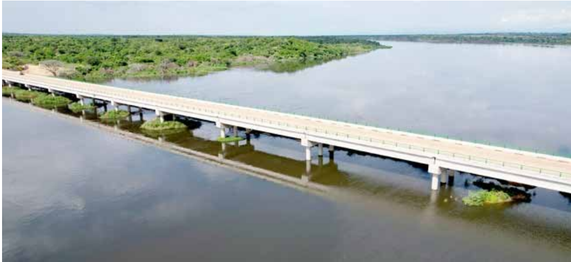
图 1-15 中企在 Paraa 国家公园建起的 Paraa 大桥