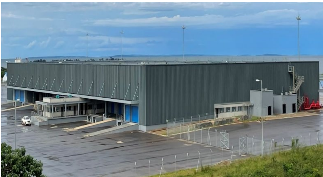
图 1-6 恩德培国际机场改扩建项目

(5) 依法纳税、创造就业：在依法纳税方面，中资企业通过按时、按法规纳税，为乌干达政府提供了重要的财政收入，支持了国家的基础设施建设、社会服务和公共事业发展，这些企业通过纳税，为乌干达政府提供了稳定的财政收入。企业所得税的缴纳直接促进了乌干达的财政健康和公共服务的提供，支持了教育、医疗、基础设施建设等领域的发展；中资企业根据销售商品和提供服务的价值，按照乌干达的增值税法规定纳税。增值税是乌干达的重要税种之一，通过增值税的纳税，中资企业为乌干达政府提供了消费税收入；按照乌干达的个人所得税法规定，企业从员工的工资、奖金和其他收入中扣除并缴纳个人所得税。个人所得税是乌干达税收体系的重要组成部分，通过个人所得税的纳税，中资企业为乌干达政府提供了个人所得税收入；除了上述税种外，中资企业还按照乌干达法律法规的要求缴纳其他税收和费用，如营业税、土地使用费等。这些税收和费用的缴纳为乌干达政府提供了额外的财政收入，用于支持国家的各项开支和发展。