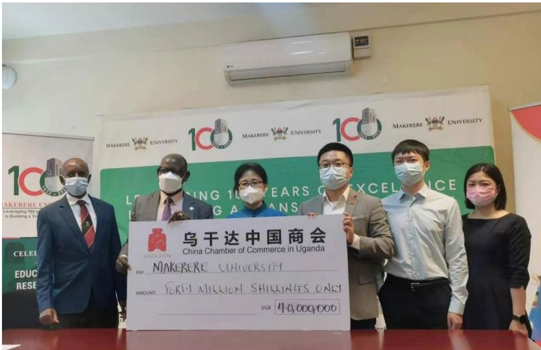
图 1-10 乌干达中国商会向麦克雷雷大学捐赠仪式

中资企业在乌干达教育领域也承担社会责任，投资和支持教育设施的建设和发展。中资企业积极投资和支持乌干达的学校设施建设和改善。它们为当地学校提供资金、物资和设备支持，改善了学校的教学环境和设施。例如，中资企业投资兴建教室、图书馆、实验室和计算机室等，提供学习和教学所需的设备和资源，提高了当地学生的学习条件和学校的教育质量。此外，中资企业在乌干达开展奖学金和助学金计划，为优秀和有需要的学生提供经济支持。这些奖学金和助学金计划可以帮助贫困家庭的学生接受良好的教育，减轻他们的经济负担，提高他们的学习机会和学术成就。中资企业为乌干达的学校和学生提供教育资源，包括教材、图书、科学设备和计算机等。这些资源的提供丰富了学校的教育内容和学习材料，帮助学生获取更广泛的知识技能。此外，中资企业还开展社区教育项目，为乌干达社区提供终身教育机会。通过组织成人教育课程、职业培训和技能提升项目，帮助成年人提高自身素质和就业能力。通过这些项目，中资企业为乌干达社区提供了更广泛的教育机会，促进了社区的发展和脱贫致富。