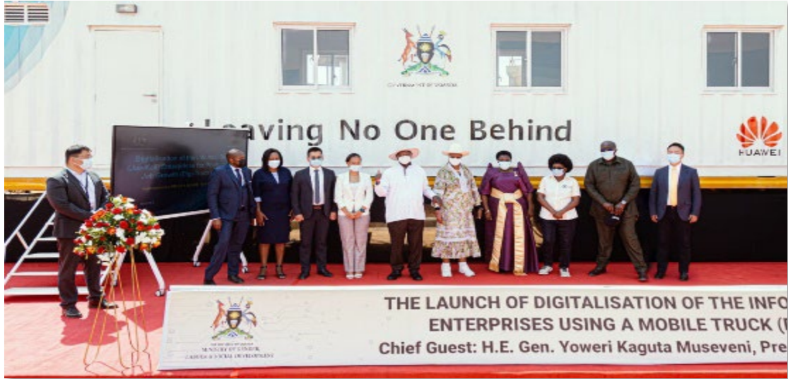
图 1-16 总统启动华为 DigiTruck 项目

中小企业 ICT 技术扶持： 自 2022 年至今已培训 7 家中小企业免费使用华为云服务。2024 年，华为云创业计划正式启动，目标是使帮助乌干达中小企业使用数字解决方案进行创新和发展。