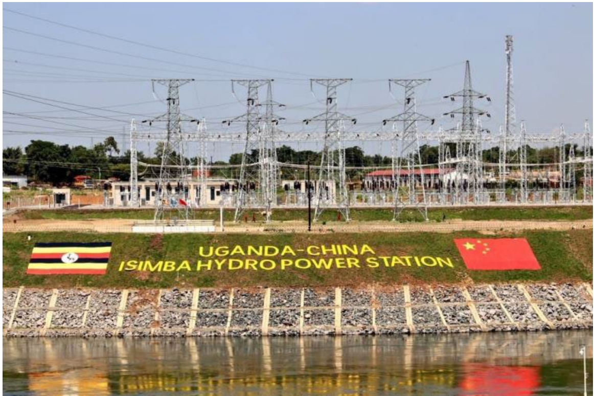
图 1-2 伊辛巴水电站