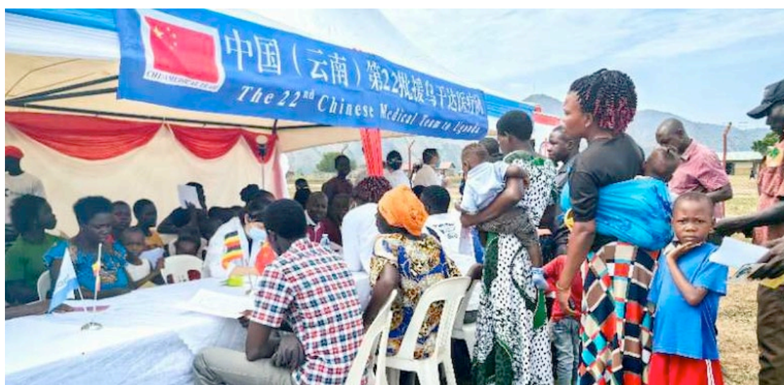
图 1-8 援乌医疗队为当地居民义诊

自 2014 年以来，中国医疗队联合乌干达中国商会一直致力于提供常见疾病的免费诊断和治疗服务，并积极开展健康教育，普及艾滋病及其他传染病的相关知识，提供心理咨询服务。他们平均每月组织一次举办义诊活动，在社区和企业组织中设立义诊区，向广大民众提供医疗服务。