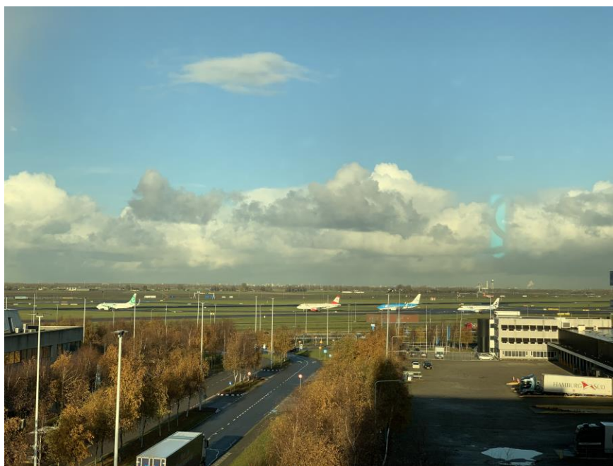
阿姆斯特丹史基浦机场

2022年，荷兰全国航空货运量为155.3万吨，同比增长13.8%。2022年客运量为6129万人次，比2021年增加了1.1倍。其中，阿姆斯特丹史基浦国际机场运送旅客量从2021年的2549万人次上升至2022年的5247万人次，货运总量从2021年的144万吨下降至137万吨。