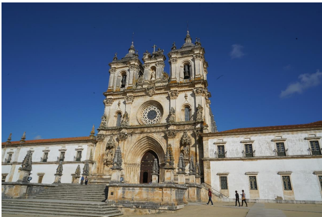
阿尔克巴萨修道院

【罢工】根据葡萄牙就业与劳动局公布的数据，2020年罢工活动明显减少，共举行650次罢工活动,同比下降39.6%，涉及司法、医疗、教育、移民局、机场管理局、消防、铁路等部门。2021年共举行872次罢工活动，较大规模的为7月葡萄牙机场地面服务人员因不满工资及休假情况罢工，导致首都机场上百架航班被取消，仅12月份就发出了224份通知，比上年同月的181份增加了24%。2022年葡萄牙共举行大大小小1087次罢工活动，较上年增长25%，罢工次数是2013年以来最多的。在葡萄牙的中资企业未发生罢工情况。