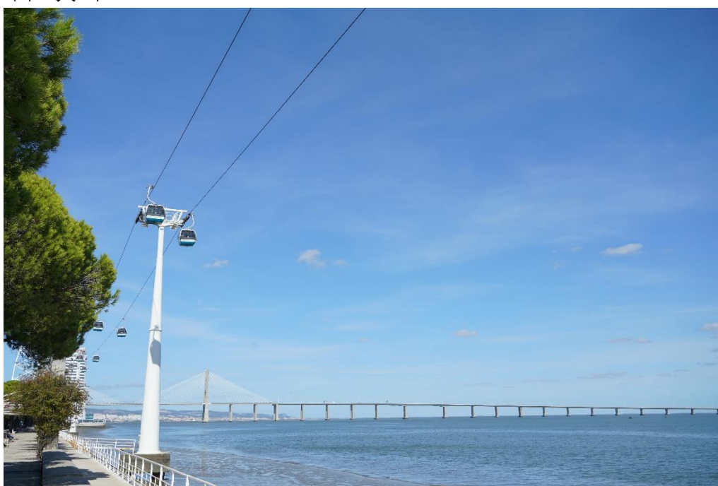
里斯本达伽马大桥

里斯本不同于世界其他主要大城市，行政上的“里斯本市”只局限在历史城区，占地100平方公里，其周边卫星城属于里斯本大区的一部分。2021年，里斯本市人口为54.59万人，里斯本大区人口约287.08万人。里斯本大区是葡萄牙最富庶的地区，人均GDP远高于全国平均水平。