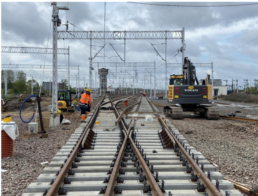
波兰E75铁路现代化改造项目