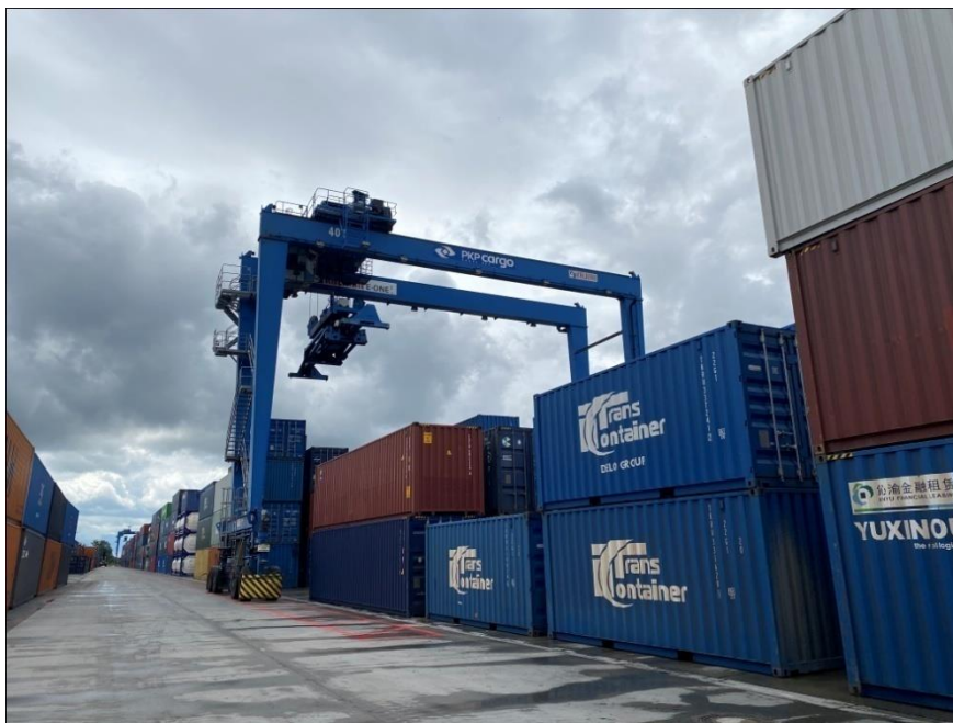
中欧班列进入欧盟的重要换轨节点波兰马拉舍维奇场站

波兰运营的铁路线是三个国际货运走廊（RFC）的一部分：RFC5波罗的海—亚得里亚海、RFC8北海—波罗的海、RFC11“琥珀”。波兰还是中欧班列进入欧盟的重要门户。