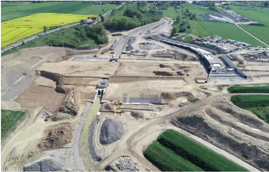
波兰奥得河防洪水库项目