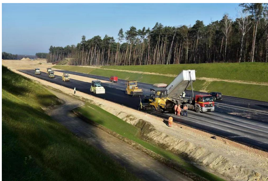
波兰S14罗兹西部绕城快速公路设计与施工项目

近3年中资企业在波新签大型工程承包项目主要有中国电建与当地公司组成联合体中标波兰E75铁路现代化改造项目、中国土木工程与西班牙Aldesa组成联合体中标波兰38号铁路修复改造项目、中国电建市政建设集团有限公司承建波兰A2高速公路LOT4段以及S14、S19、S6、S12快速路部分标段项目等。主要商业模式为欧盟基金和业主自有资金公共招投标EPC项目。