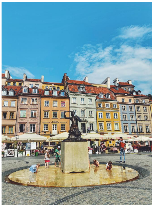
华沙老城集市广场的美人鱼雕像