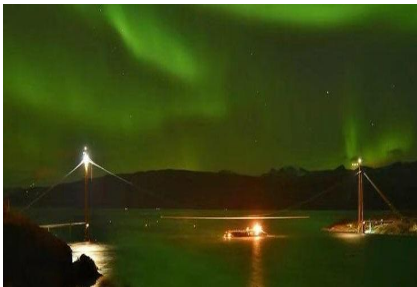
四川路桥集团承建的挪威哈罗格兰德大桥，被称为“极光之桥”