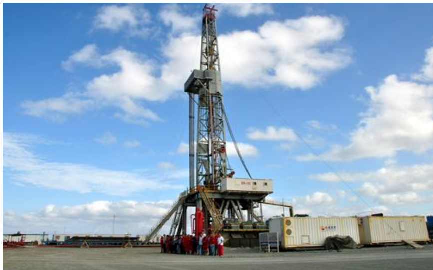
位于古巴哈瓦那近郊的石油钻探基地

据中国商务部统计，2020年中资企业在古巴新签承包工程合同37份，新签合同额3.14亿美元，完成营业额1.42亿美元。中方累计派出各类劳务人员167人，年末在古巴劳务人员383人。