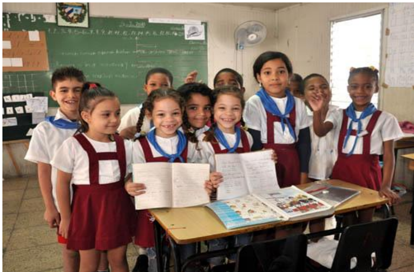
身着校服的古巴小学生

【教育】古巴政府历来重视发展教育。目前，古巴是拉美地区识字率和平均受教育水平最高的国家，教育水平居世界前列。根据联合国教科文组织《2015全民教育发展指数》，古巴在117个国家（地区）中排第28位，在拉丁美洲国家中排名第一。