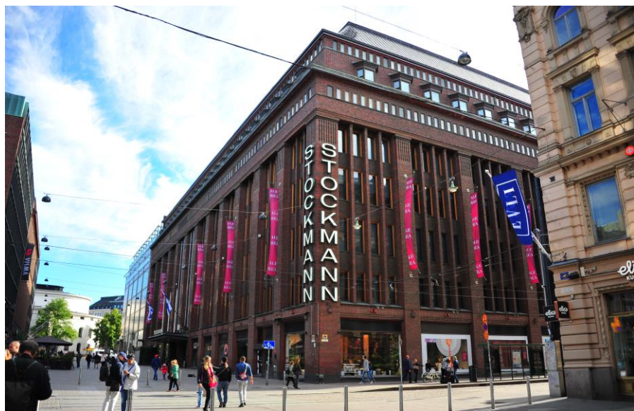
斯托克曼百货商店

2018年9月起,芬兰最大的百货公司斯托克曼(Stockmann)正式推出支付宝作为支付方式。目前,支付宝已在芬兰多个购物中心和商店得到广泛应用。