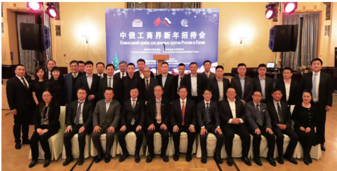
2019年12月 俄罗斯中国总商会理事单位年会暨中俄工商界新春招待会

为了凝聚行业企业，使企业少走弯路，促进经验共享、合作共赢，俄罗斯中国总商会牵头组织成立了汽车与工程机械行业分会、金融行业分会、法律行业分会、旅游行业分会、建筑行业分会、电商行业分会等多个行业分会。在中俄地区合作年期间，发挥地方中资企业优势，成立圣彼得堡分会、远东地区分会（筹），协助国内湖北、河南，俄鞑靼斯坦共和国、俄远东发展署等多个地方政府与机构的相互推介活动，加强地区合作。加强中俄政策研究与培训，定期不定期开展海关通关知识培训、移民务工政策培训、消费市场产品电子商标政策培训等活动，积极引导在俄中资企业了解驻在国政策，依法合规经营。通过在俄国家级经济主场活动（彼得堡国际经济论坛、东方经济论坛）组织中俄金融合作论坛、中俄商务对话等品牌活动，逐步在俄官方树立我中资企业与商会正面形象，积极引导正面对话。伴随中资企业赴俄投资步伐加大，直接投资项目增多，与俄罗斯总统企业家权益保护全权代表机构签署合作协议成立中俄企业权益保护中心，积极为企业探索多元化的争端解决机制。关注关爱青年企业家成长，与中国青年国际交流中心，俄青年联盟一道建立中俄青年创新创业孵化器（莫斯科），支持两国青年企业家合作开展创新创业项目。今年在抗击新冠肺炎疫情期间，在俄中资企业积极响应总商会号召，捐款捐物，千里驰援国内，并主动帮扶在俄同胞弱势群体，积极向驻在国捐赠抗疫物资，以实际行动践行新时代中俄守望相助，背靠背、肩并肩的高水平全方位合作。