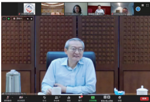
中国驻欧盟使团大使张明

张明大使指出，当前国际形势波谲云诡，中国企业“走出去”面临的外部形势更加复杂严峻，也更加凸显境外中资企业商（协）会发展的重要性。希望广大境外商会在坚持自身发展特色的同时，大胆吸收欧美同行的有益经验为己所用，不断完善体制机制建设，进而在维护权益、反映诉求、加强游说等方面发挥更加重要的作用。