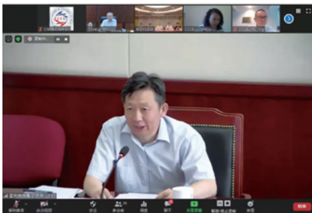
国务院发展研究中心副主任隆国强

张明大使指出，当前国际形势波谲云诡，中国企业“走出去”面临的外部形势更加复杂严峻，也更加凸显境外中资企业商（协）会发展的重要性。希望广大境外商会在坚持自身发展特色的同时，大胆吸收欧美同行的有益经验为己所用，不断完善体制机制建设，进而在维护权益、反映诉求、加强游说等方面发挥更加重要的作用。