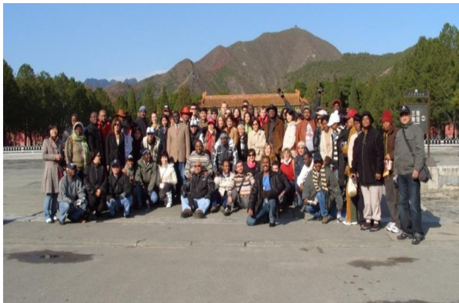
摩尔多瓦学员在华参加培训