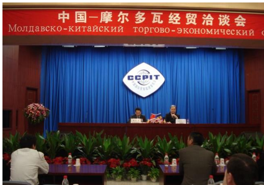
中国—摩尔多瓦经贸洽谈会

达成一系列共识，还签署了关于中摩自由贸易协定可行性研究的谅解备忘录，宣布正式启动自贸协定联合可研工作。双方还就在两国经济技术合作协议框架下尽快落实铁路货运车厢和机场行李检测系统、太阳能电站和通讯指挥系统三个项目达成了共识。