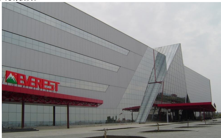
“三联”公司在摩尔多瓦投资的大型商贸综合中心