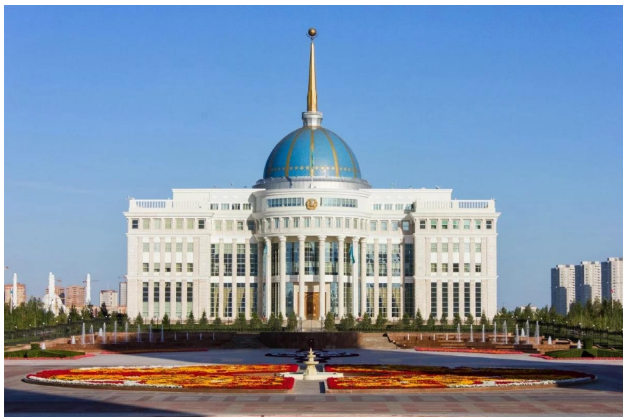
哈萨克斯坦总统府

独联体联合防空体系和独联体反恐中心成员国；为上海合作组织成员国，主张扩大组织成员国的军事交流；积极发展与美国及北约关系，扩大与其在军事领域的合作。