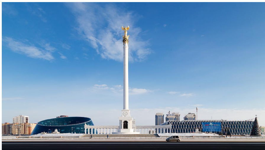
努尔苏丹独立广场

联合国毒品和犯罪问题办事处（UNODC）统计数据显示，2017年哈萨克斯坦共发生谋杀案件915起，每10万人比率（下同）为5.00；袭击案件2050起，比率为11.26；绑架案件74起；抢劫案件9469起。