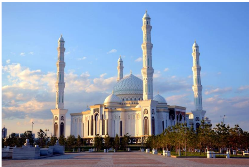
哈兹拉特苏丹清真寺