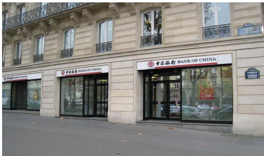
中国银行巴黎分行

【中资银行】中国与法国在金融领域的合作不断深化。中国银行巴黎分行资产已超过30亿欧元，员工数量近百人。工商银行巴黎分行于2011年初正式开业，荣获法国2011年度最佳投资奖；中国进出口银行巴黎分行于2013年10月正式成立，建设银行巴黎分行2015年7月正式成立。